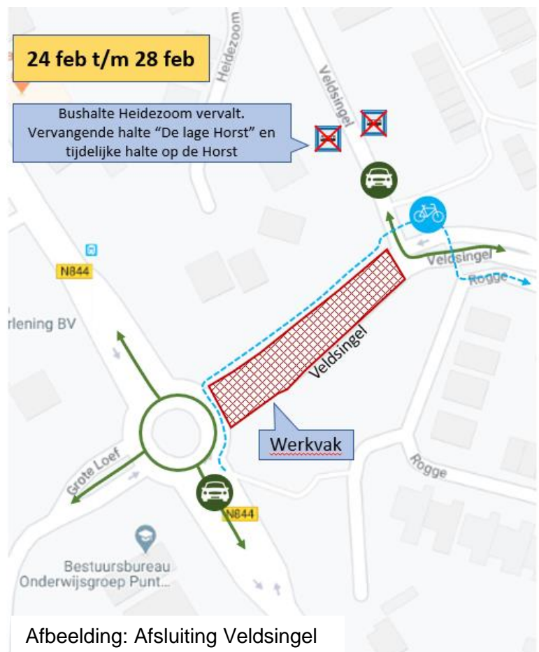
Afbeelding: Afsluiting Veldsingel